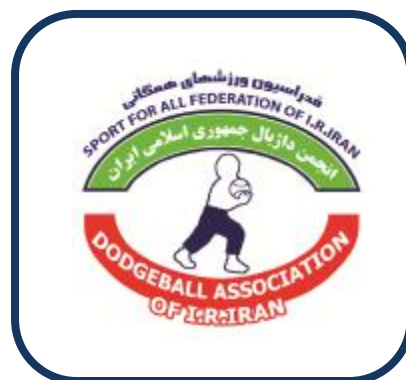
انجمن داژبال جمهوری اسلامی ایران