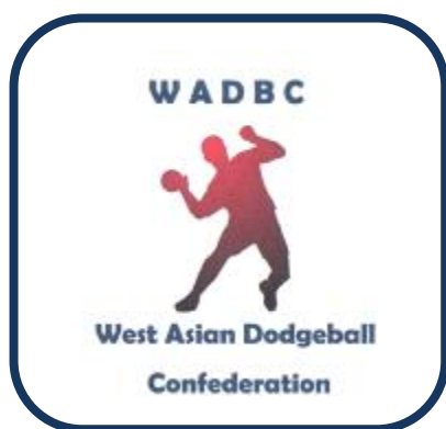
کنفدراسیون داژبال غرب آسیا